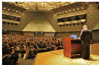
※前回の開催状況です。